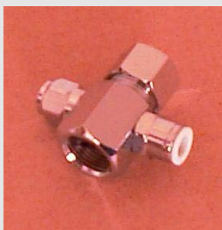
Té de connexion 3/8' pour tuyau dont le filetage est en 12x17