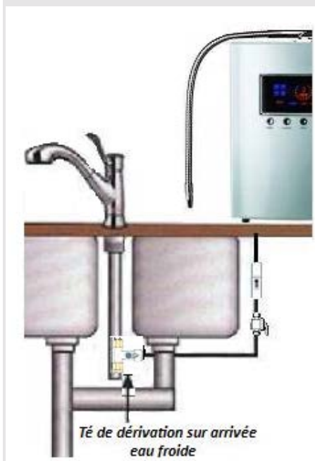
Exemple avec le modèle " ORION "